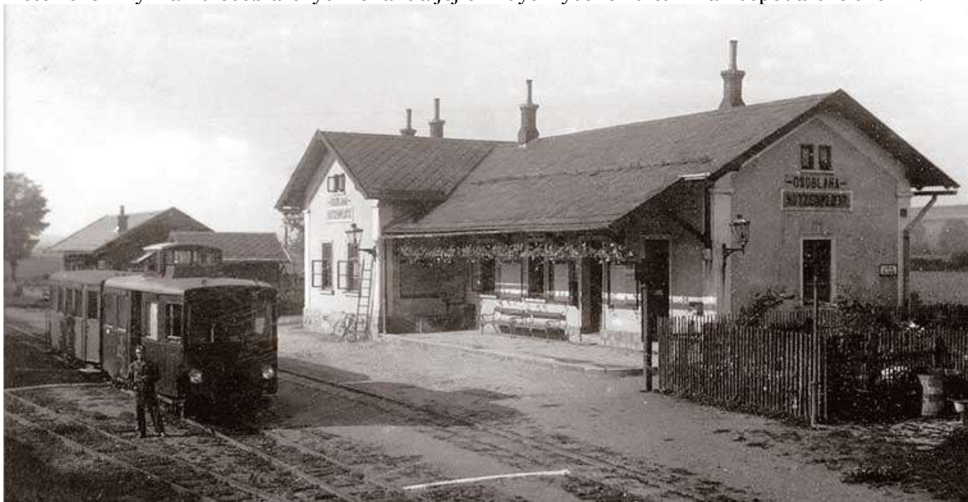
Nádraží v Osoblaze roku 1930. Tehdy se ještě tomuto regionu přezdívalo Slezská Haná.

Zajímavých informací se turista dozví celou řadu. Naučná cyklostezka tak svědčí o historickém významu osoblažských lokalit a jejich kdysi vysoké kulturní a hospodářské úrovni.